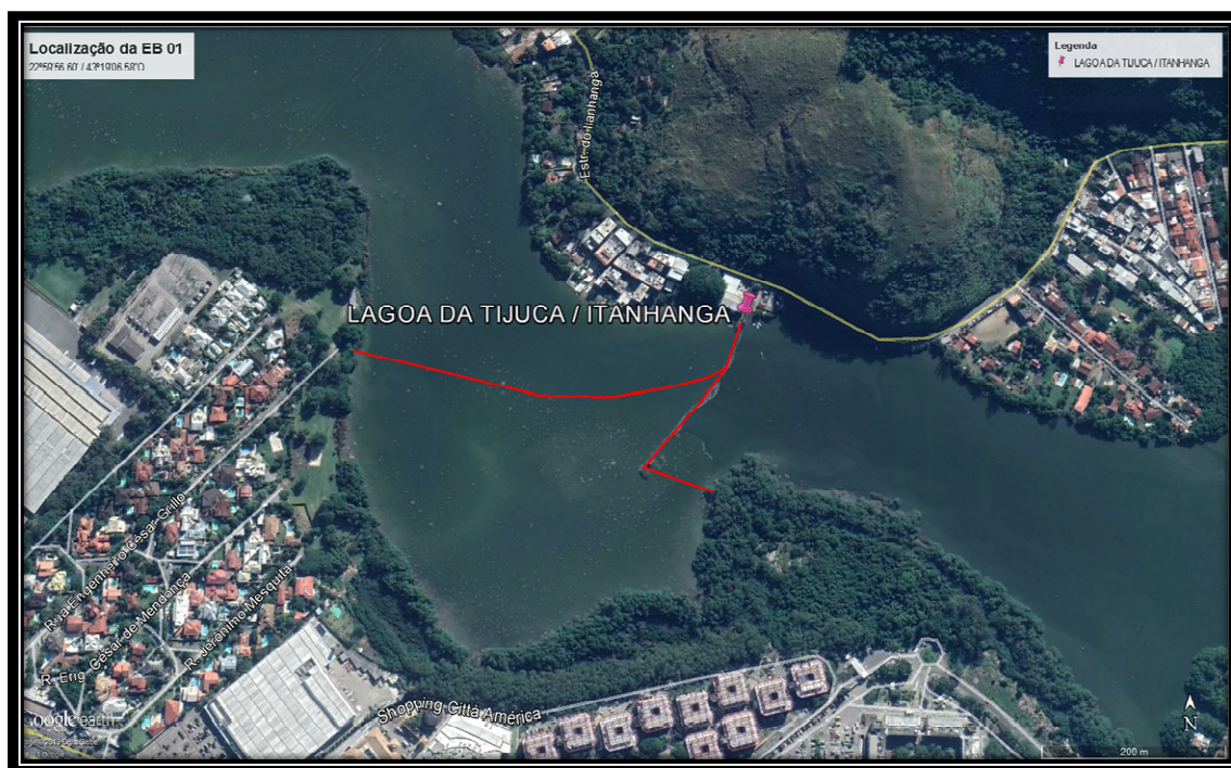
Figura 3: Localização das Ecobarreiras da Lagoa da Tijuca/Itanhangá