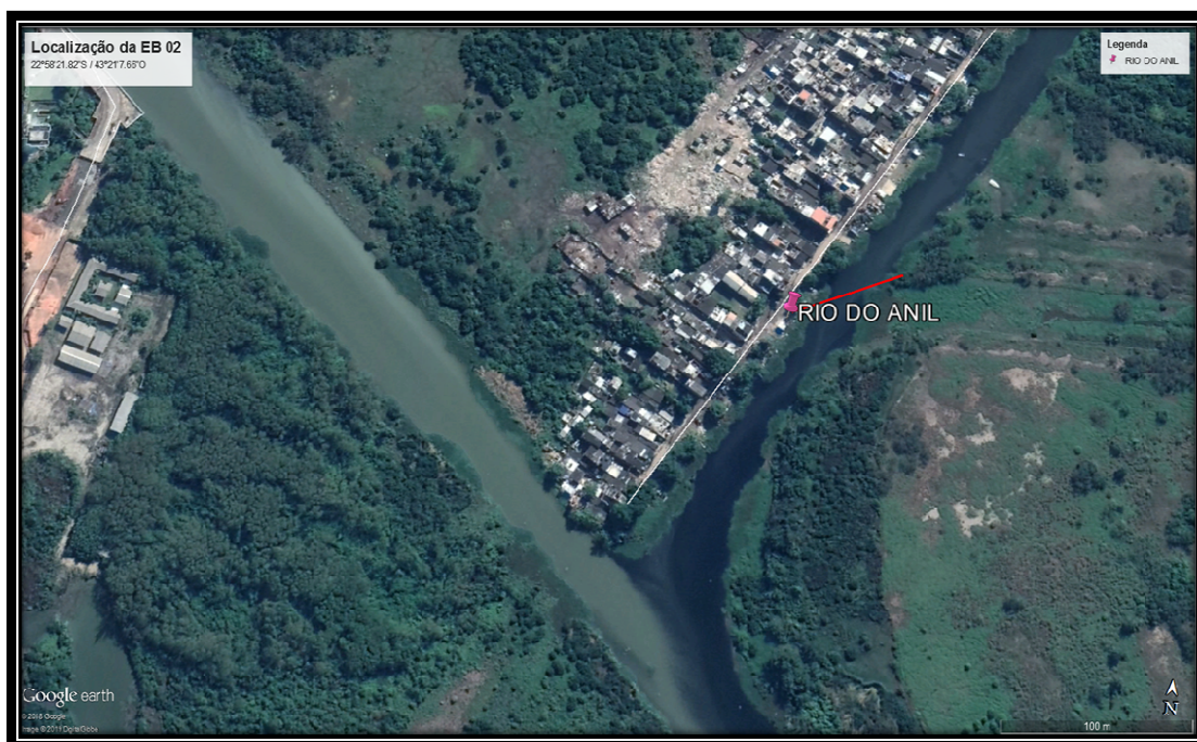
Figura 4: Localização da Ecobarreira do Rio Anil