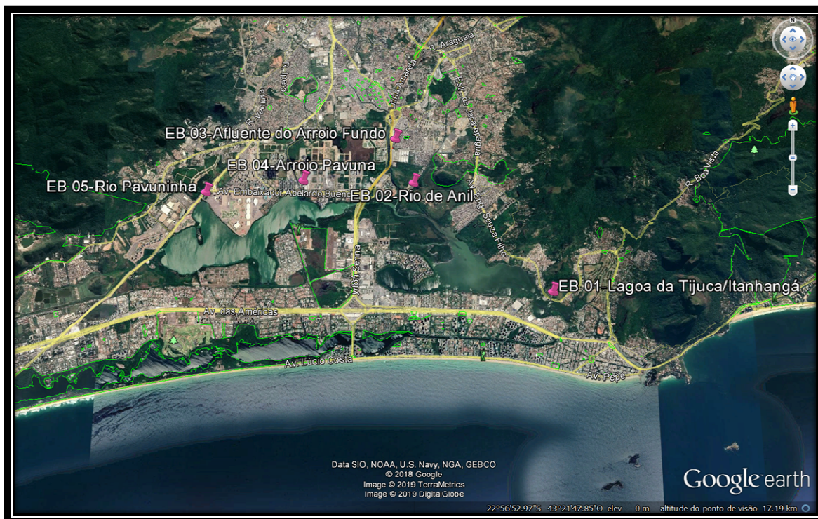
Figura 2 – Mapa de localização das bases operacionais no complexo lagunar de Jacarepaguá.

Conforme a quadro a seguir, são apresentadas as coordenadas de todos os locais que pertencem a este Termo de Referência: