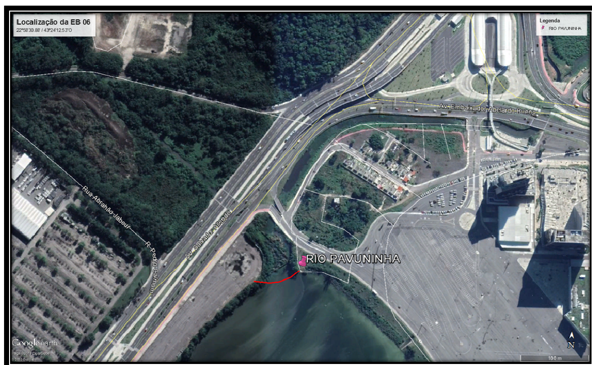
Figura 7: Localização da Ecobarreira do Rio Pavuninha