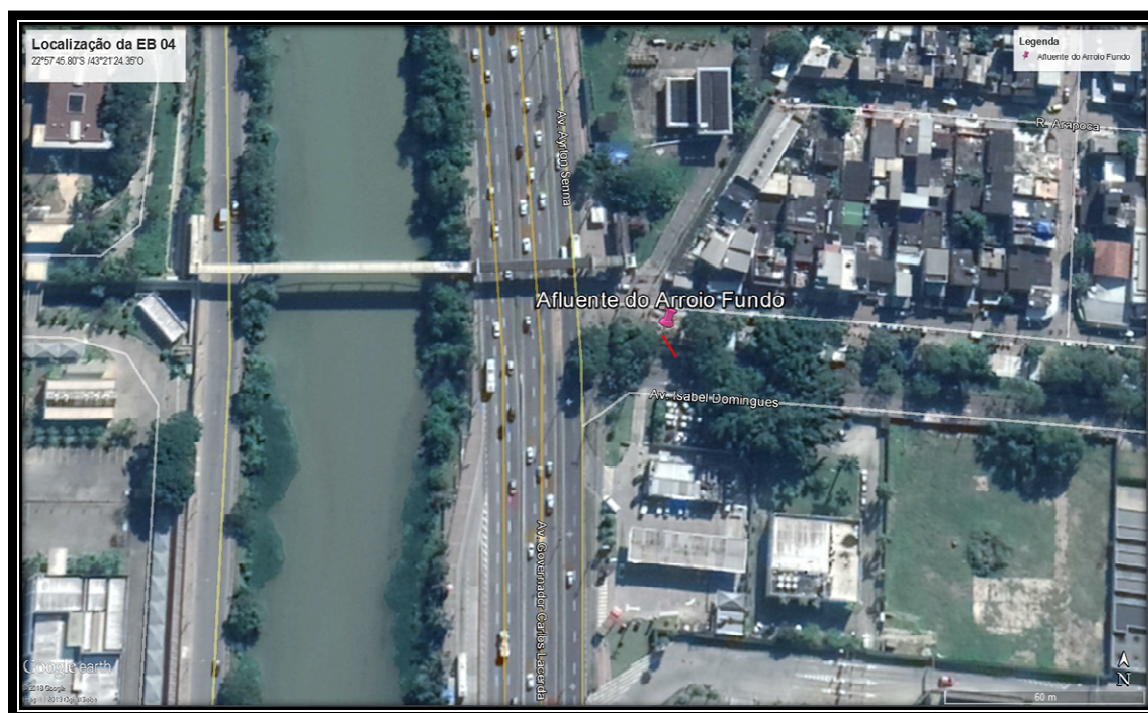
Figura 5: Localização da Ecobarreira do Afluente do Rio Arroio Fundo