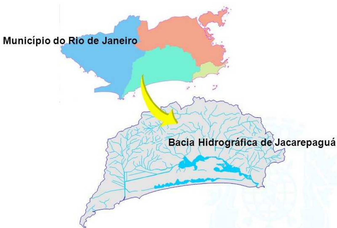
Figura 1 - Localização da Bacia Hidrográfica de Jacarepaguá

A realização dos serviços propostos fará com que os corpos hídricos tenham maior efetividade em sua função hidráulica, colaborando para evitar a disseminação de doenças, proliferação de vetores e diminuição das enchentes que tanto afetam a população.