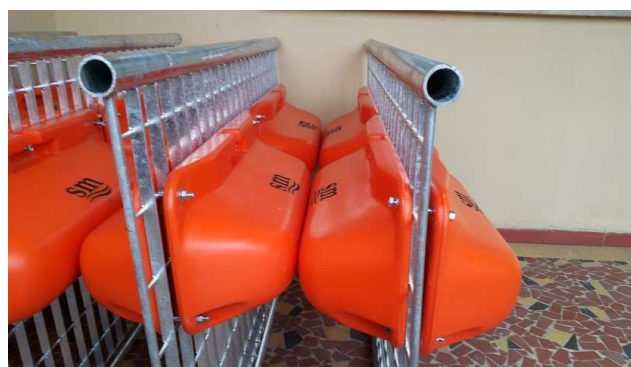
Figura 14: Exemplo de Ecobarreira metálica