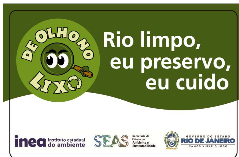
Figura 13: Modelo de placa do Programa Olho no Lixo