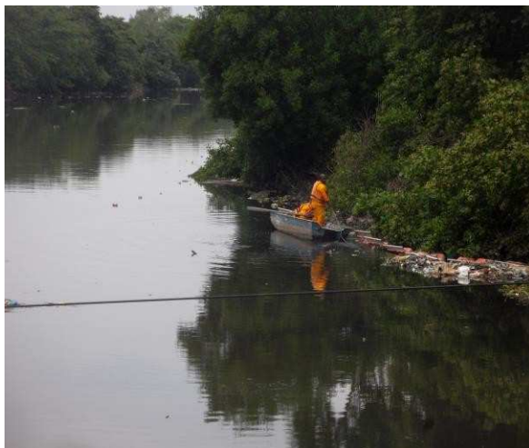
Figura 11: Exemplo serviço de barco de apoio