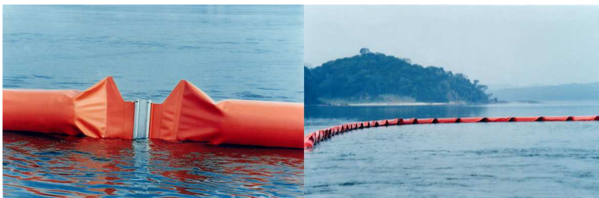
Figura 15: Exemplo de Ecobarreira termoplástica