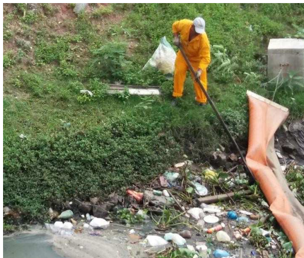
Figura 9: Exemplo operação manual