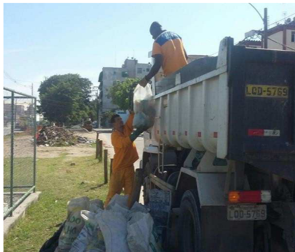
Figura 10: Exemplo de carga até o transporte