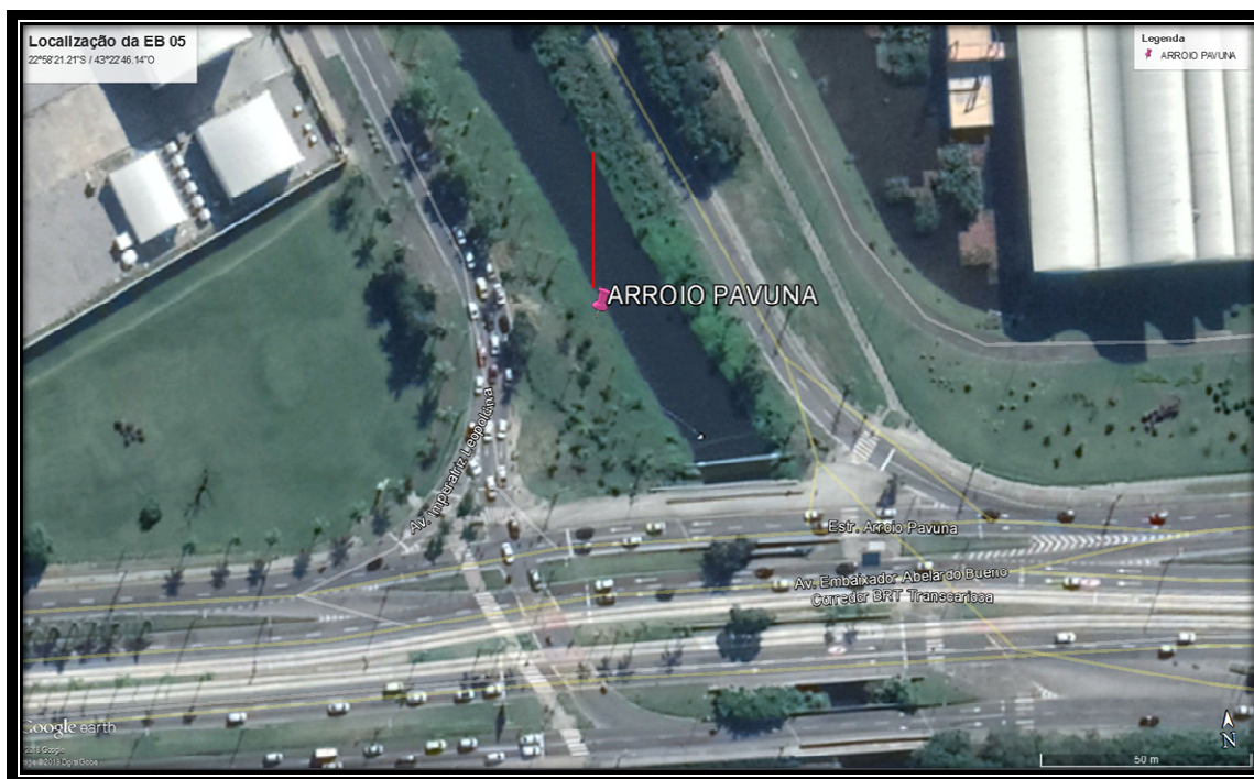
Figura 6: Localização da Ecobarreira do Arroio Pavuna