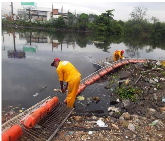
Figura 8: Exemplo de manutenção das ecobarreiras

As ecobarreiras foram classificadas quanto ao modelo de barreira e o tipo de operação, sendo descritos abaixo: